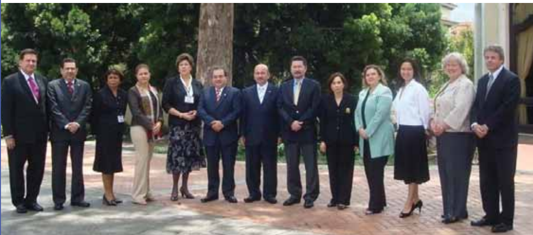
Reunión de Viceministros (as) en la XIV CRM, Guatemala, 2009.