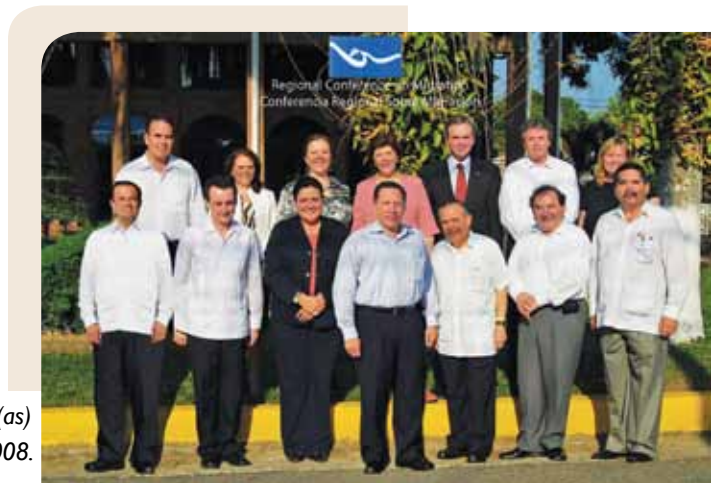
Reunión de Viceministros (as) en la XIII CRM, Honduras, 2008.

La Reunión Anual de los Viceministros(as) de Interior/Gobernación/Seguridad y Relaciones Exteriores de los países miembros es el órgano que toma las decisiones de la Conferencia Regional sobre Migración (CRM). Estas son imágenes de algunas de las reuniones más recientes.