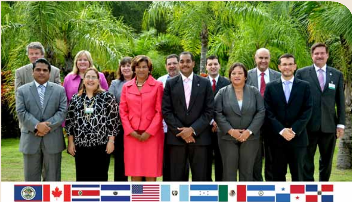
Reunión de Viceministros(as) en la XVI CRM, República Dominicana, 2011.