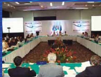
XV CRM, Chiapas, México, 2010.