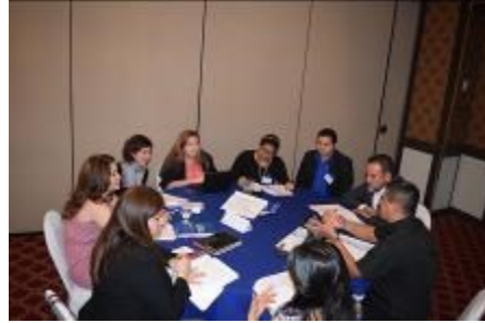
El Taller de Validación de Documentos sobre Niñez Migrante contó con amplia participación.