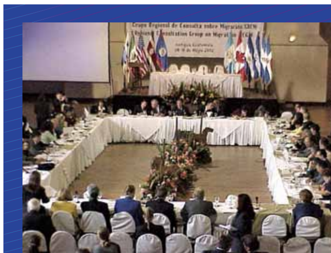
VII CRM, Antigua Guatemala, 2002.

Además de brindar un espacio para el diálogo y el intercambio de información entre los gobiernos, se ha desarrollado una vasta serie de actividades en el marco de este proceso regional: pro-