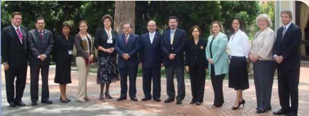
Reunión de Viceministros (as) en la XIV CRM, Guatemala, 2009.

La Reunión Anual de los Viceministros(as) de Interior/Gobernación/Seguridad y Relaciones Exteriores de los países miembros es el órgano que toma las decisiones de la Conferencia Regional sobre Migración (CRM). Estas son imágenes de algunas de las reuniones más recientes.