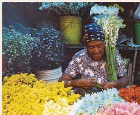
Migrante haitiana laborando en República Dominicana.