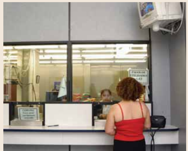
Envío de remesas desde Estados Unidos.