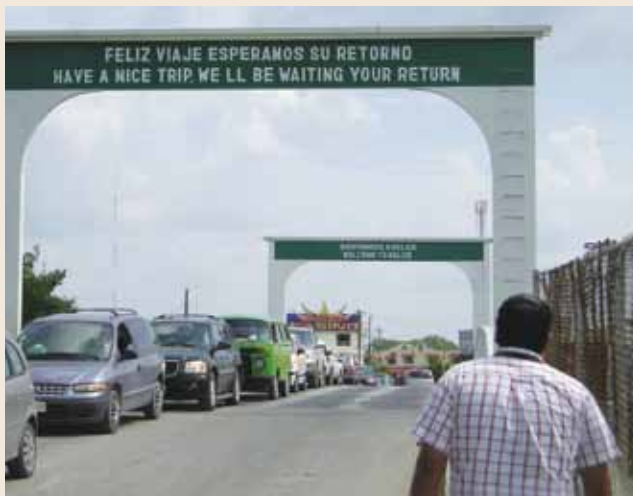
Paso fronterizo entre México y Belice.