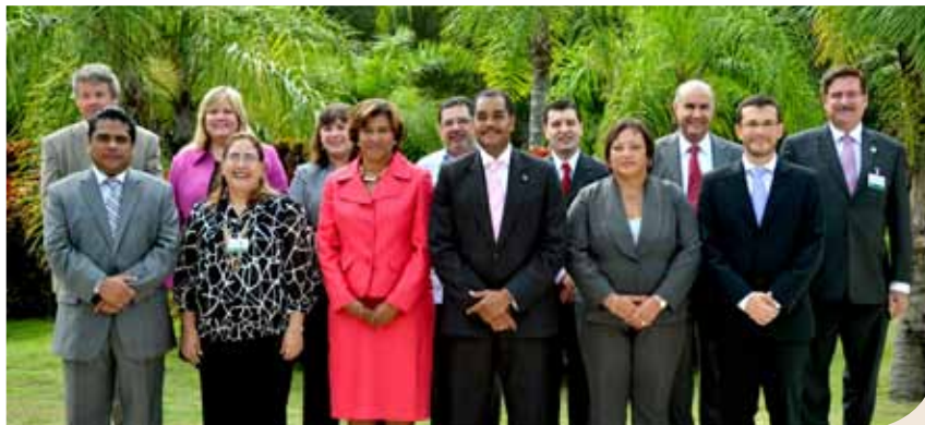
Reunión de Viceministros (as) en la XVI CRM, República Dominicana, 2011.