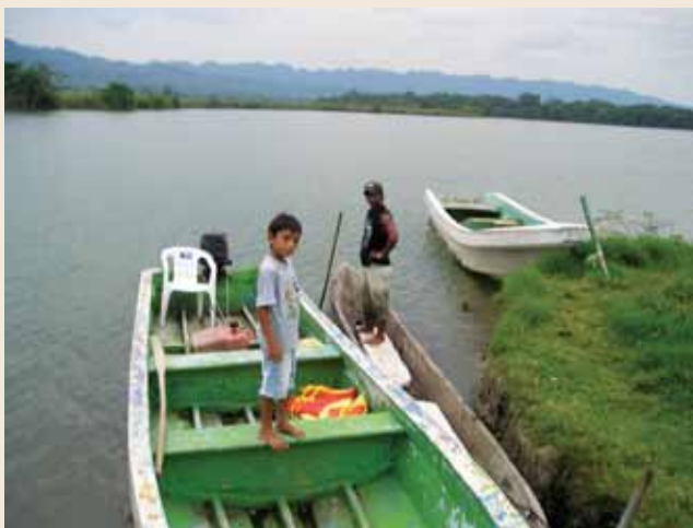
Embarcadero en puesto fronterizo El Martillo, Tabasco. México.