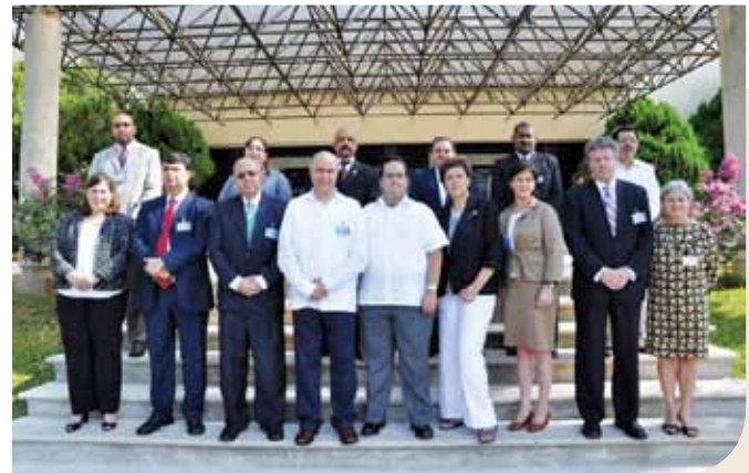
Reunión de Viceministros (as) en la XV CRM, México, 2010.