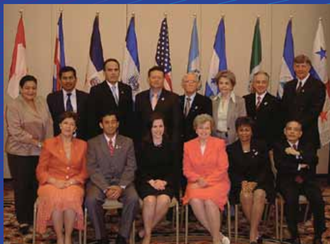
XII CRM, Nueva Orleans, Estados Unidos, 2007.

Finalmente, las conclusiones y reflexiones resumen los logros y reconocen los retos presentes y futuros que aguardan al Proceso Puebla.