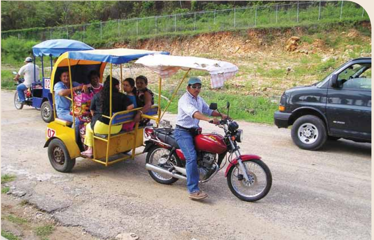
Dinámica fronteriza en El Ceibo, Tabasco, México.