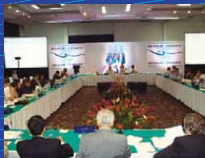
XV CRM, Chiapas, México, 2010.