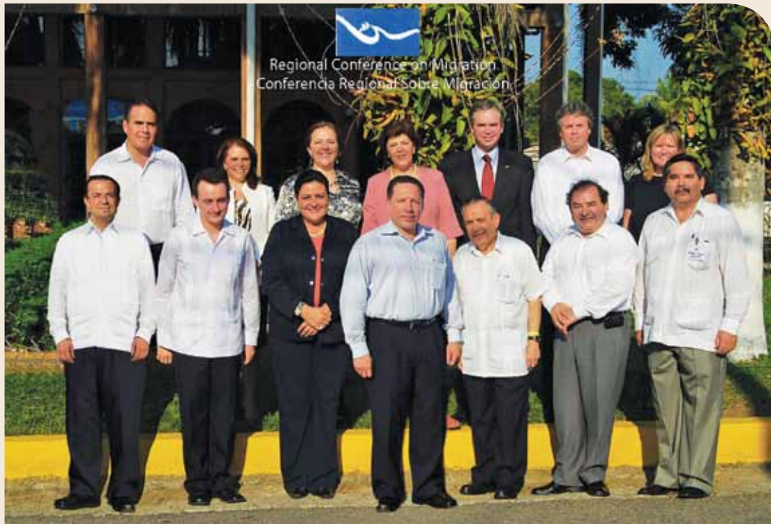
Reunión de Viceministros (as) en la XIII CRM, Honduras, 2008.